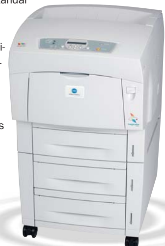
magicolor 3300 con alimentador de alta capacidad para 1.000 hojas