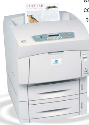
magicolor 3300 con alimentador de 500 hojas