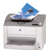
magicolor 2430 DL