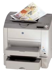
magicolor 2430 DL com alimentador inferior opcional 500 folhas e duplex opcional (parte traseira)