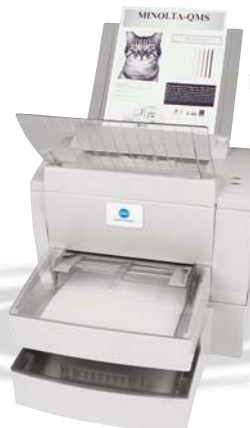
PagePro 1250E com Alimentador Inferior 500 folhas opcional e Bandeja de Saída Face para Cima