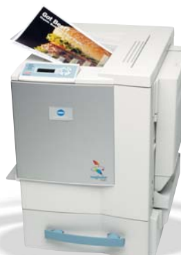
magicolor 2350 EN com alimentador inferior 500 folhas opcional e unidade duplex.