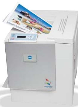
magicolor 2350 EN