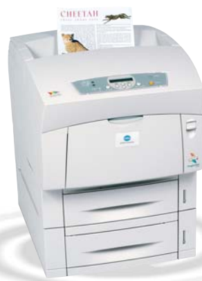
magicolor 3300 com Alimentador 500 Folhas