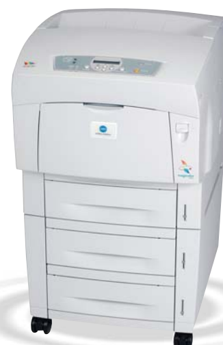
magicolor 3300 com Alimentador de Alta Capacidade 1.000 Folhas